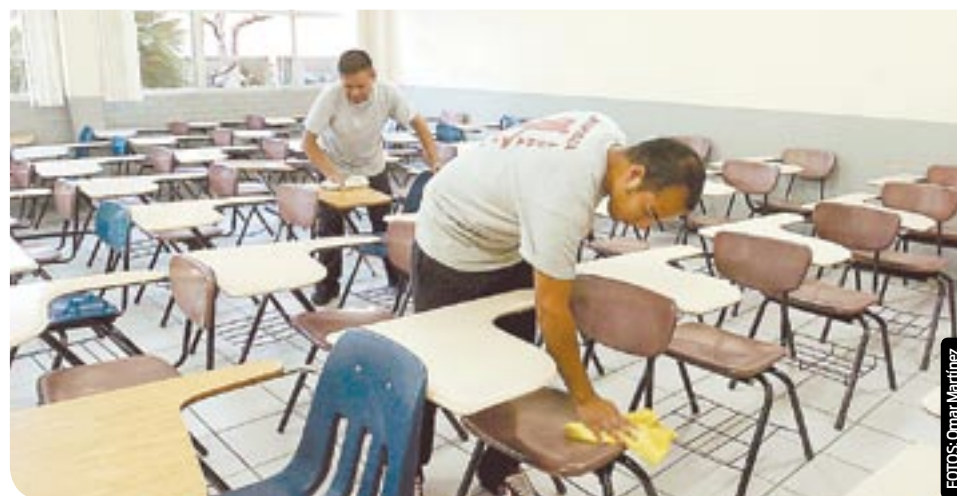
Personal de mantenimiento de la Universidad limpió algunos de los salones del campus.

Sin embargo, hasta el cierre de la edición las autoridades educativas de la UABC no emitieron información al respecto, sólo se supo que varios alumnos, principalmente de Derecho, se retiraron a sus casas.